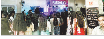
धर्मशाला कच्ची खोली में फ्रेशर पार्टी का आयोजन

जिला प्रशासन द्वारा डिग्री कॉलेज के छात्रों को कार्यक्रम का पूरा खर्चा देने का वादा कर एन वक्त पर मुकर जाने से सीनियर छात्रों ने अहम भूमिका निभाई है। उनके द्वारा खुद के खर्चे से सिंधी